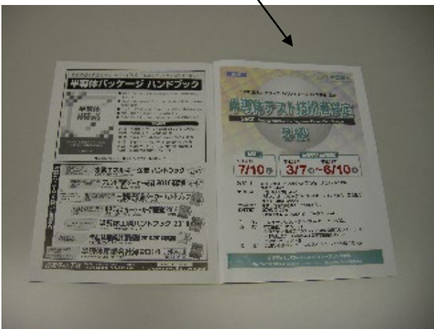
表3 カラー (一般 18 万円/会員 16 万円)