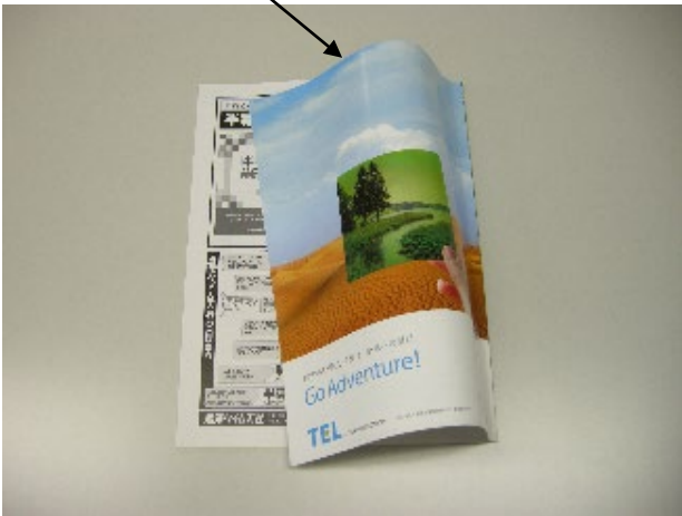
表4 カラー (一般 20 万円/会員 18 万円)