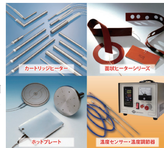
各種産業用ヒーターで 多様なニーズに応える

おかげさまで創業100周年。本展示会では、産業用ヒーター、各種温度センサー、高精度な温度調節器などのアイテムを多数出品いたします。お客様のご要望を伺い、加熱プロセスに応じた最適な製品をご提案いたします。