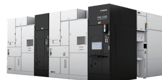
ナノインプリント 半導体製造装置 FPA-1200NZ2C