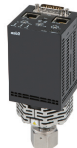
サファイア真空計 形 V8

真空計のゼロ点シフトはユーザーにとって大きな課題です。MEMS 技術を用いた改良を施し、デポによるゼロ点シフト量は、当社従来製品比較で1/10と大幅に改善しました。