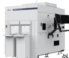
ウェーハ 外観検査装置 INSPECTRA