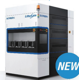
コータ・デベロッパ RF-200EX