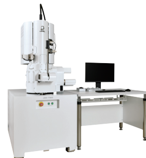
超高分解能 汎用 FE-SEM

故障解析、プロセス開発、リソグラフィー用途として用いられるそれらの製品紹介およびアプリケーションの紹介を行います。奮って弊社ブースへお越しください。