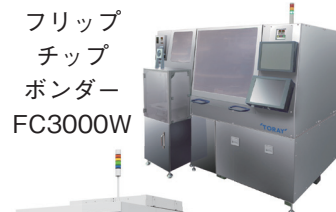
フリップ チップ ボンダー FC3000W

最先端2.5D/3D パッケージ向けの高精度実装技術を用いたフリップチップボンダーと最先端要素技術、ならびに弊社グループの東レエンジニアリング先端半導体 MI テクノロジー(株)がパワー、車載、μ LED など、様々なデバイスや工程で最適な検査ソリューションを提供するウェーハ外観検査装置や AI 欠陥分類システムを展示します。