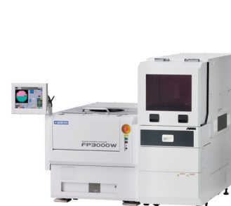
初出展 Flamed wafer probing machine FP3000W

また、今回はダイサ、プローバ、計測技術を融合した製品、それぞれ新製品をご紹介します。皆さまのお越しをお待ちしております。