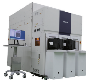
高分解能 FEB 測長装置 GT2000

「加工する・見る・測る・分析する」技術を通じてお客さまの課題解決に取り組み、開発期間短縮・コスト低減・生産性向上などの価値創造をめざして、プロダクトにデジタルを加えた世界トップレベルのソリューションをお届けします。