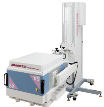
V93000 EXA Scale™