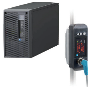
(左) ミニ UPS 「GX100シリーズ」 (右) 小型超音波流量計「S-Flow」

富士電機は、半導体製造装置の電源トラブルを解決するミニ UPS の新製品「GX100シリーズ」を展示いたします。また、検出器と変換器の一体構造のため簡単設置・省スペースを実現する小型超音波流量計や、装置の省スペース化を実現する多軸サーボアンプ一体型コントローラのデモ機展示などを行います。ご来場の際は是非弊社ブースへお立ち寄り下さい。