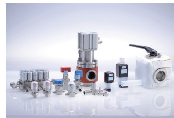
半導体製造プロセス用 バルブ各種

高純度ガス系バルブでは使用環境温度別の製品展示や、安全対策バルブの比較体験コーナーを設置いたします。WET プロセス系の製品においては PFA 製のチューブや継手を溶着する『新型溶着機』も出展いたしますので是非当社ブースにお立ち寄りください。