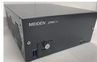
\mu PIBOC シリーズ 『 \mu PIBOC DS100』

産業用コントローラ \mu PIBOC シリーズの最新モデル『 \mu PIBOC DS100』を動態展示致します。また高速演算 / 高信頼性 / コンパクト化を実現した産業用コントローラ、各種半導体製造装置向けパッケージソフトウェアをご紹介します。