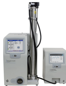
走査式モビリティパーティクルサイザー SMPS3938シリーズ

最先端の半導体製造プロセスでは、微細化の進歩とともに「シングルナノ」がキーワードとなっており、当社展示ブースでは、シングルナノパーティクルの粒径・個数計測・分級捕集が可能な計測器や、卓上利用可能な金属ナノ粒子生成装置を展示いたします。パーティクル計測に関するご相談などございましたら、お気軽にご来訪・お問合せください。