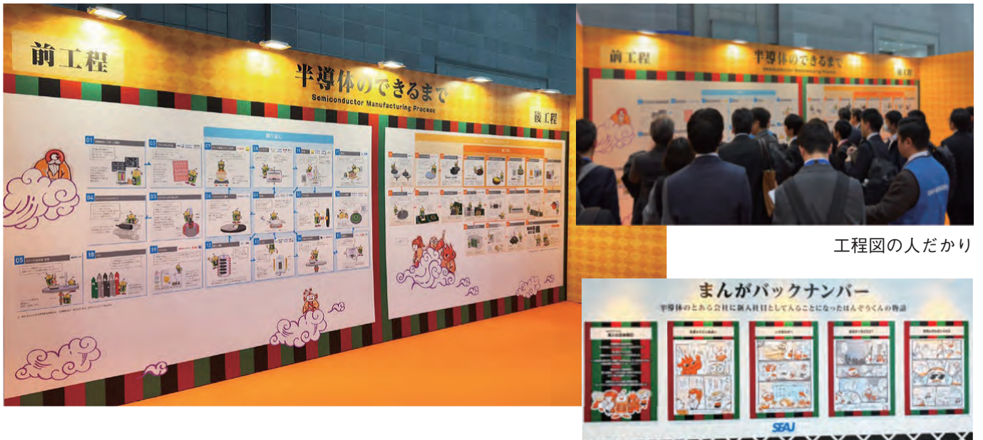
工程図の人だかり

シアターでは刷新された未来動画の映像を表現、「はんぞうくんの新入社員体験記-業界あるある」マンガの続編展示や、おなじみの「半導体のできるまで」工程図を展示、一昨年以上の盛り上がりとなりました。