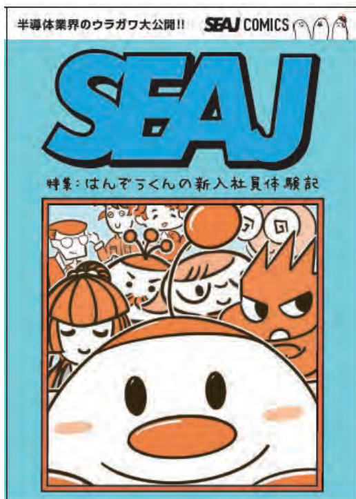
リーフレット表紙

会場では今年もアップデートした「半導体のできるまで」工程図や、協賛いただいたSEAJ会員27社の企業案内、会場に展示するマンガがそのまま入った特製リーフレットをお配りしています。学生/若手社員の皆さん、是非足を運んでみてください。